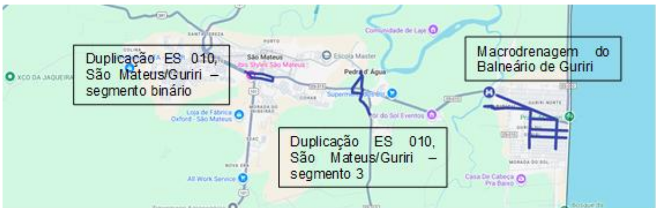
Fig. 2 – Obras em execução pelo DER-ES em São Mateus

Entre as regiões Centro Oeste e Nordeste, na ES 230 e variantes, 38,60 km estão em implantação e pavimentação, de Vila Valério a Fátima, já tendo sido gastos R$ 100.319.105,26 (55%) e com previsão de serem executados outros R$ 66.649.310,62 até dez/2025.