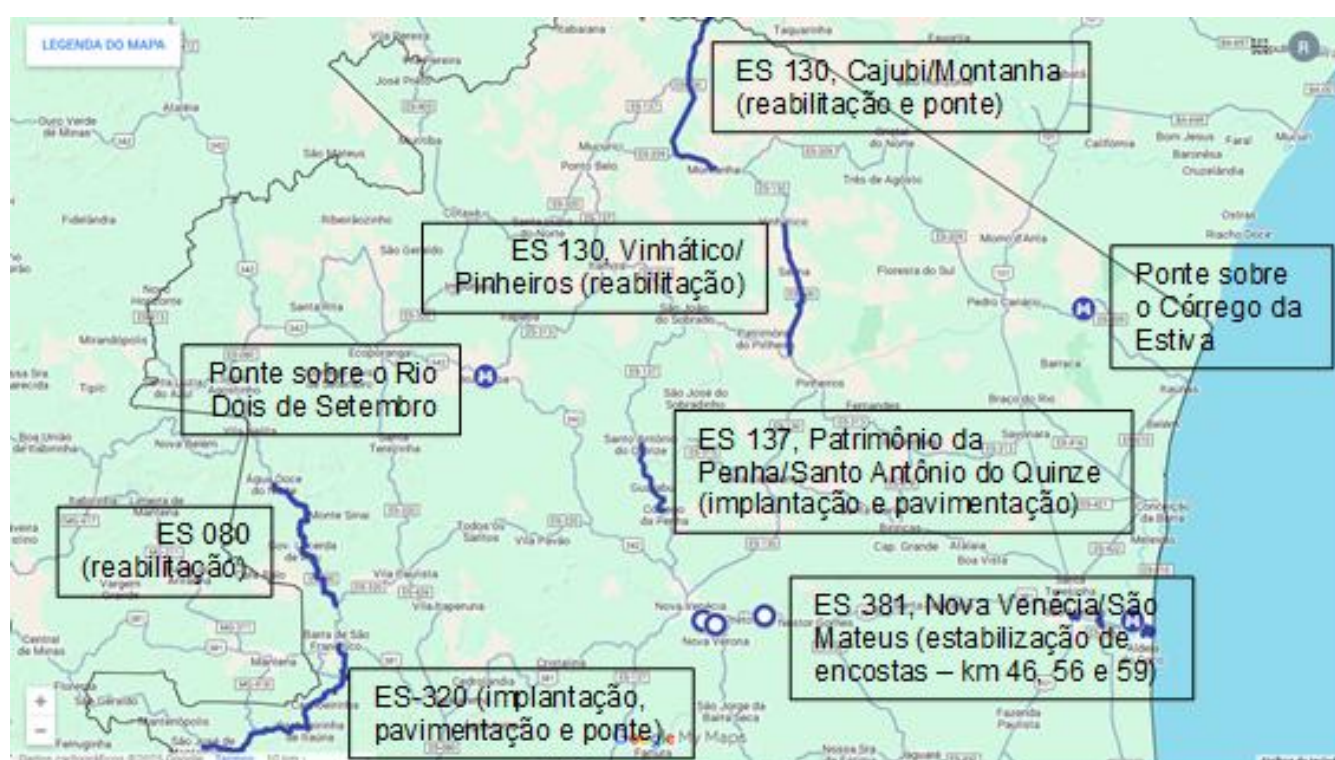
Fig. 1 – Obras em execução nas Regionais Nordeste e Noroeste

Na Regional Rio Doce, são três obras de implantação, pavimentação, reabilitação, e melhorias operacionais em rodovias estaduais. Mais uma de macrodrenagem no Balneário de Guriri e a duplicação da ES 010, no trecho São Mateus/Guriri. Totalizam 128,76 km de rodovias que já tiveram investimentos de R$ 1.048.401.301,77 . Essas obras estão em fase inicial e ainda serão aplicados nelas o significativo valor de R$ 549.926.240,54 . E devem ser entregues até julho/2026, exceto a macrodrenagem que fica para dezembro/2028.