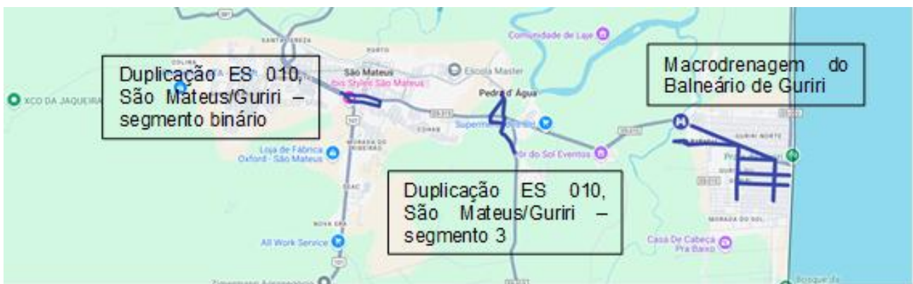
Fig. 2 – Obras em execução pelo DER-ES em São Mateus

Entre as regiões Centro Oeste e Nordeste, na ES 230 e variantes, 38,60 km estão em implantação e pavimentação, de Vila Valério a Fátima , já tendo sido gastos R$ 100.319.105,26 (55%) e com previsão de serem executados outros R$ 66.649.310,62 até dezembro/2025.