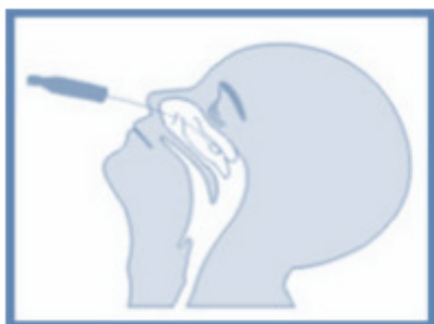
Figura 2. Técnica para a coleta de swab combinado