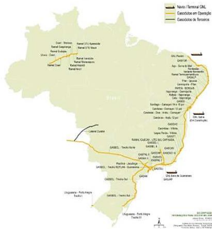
Malha de Transporte